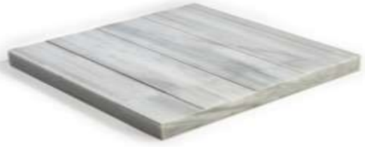
Λευκός φυσικός λίθος όδευσης τυφλών διαστάσεων 20X20 cm.