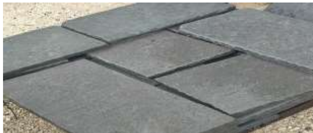
Φυσική πέτρα γκρι απόχρωσης, πλυμένη, κομμένη σε διαστάσεις 20,30 και 40 cm πλάτους και μεταβλητού μήκους.